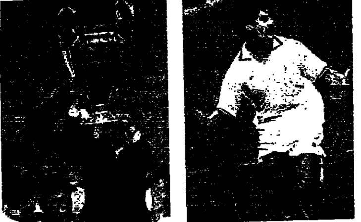
رايكارد سجل هدف الفوز